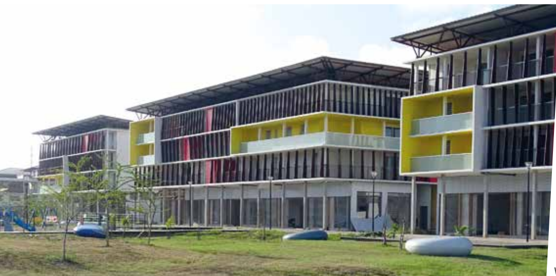
Vue du bâti ZAC Hibiscus - Cayenne

Afin de produire une nouvelle Ortho HR (mosaïque d'orthophotographies numériques en Haute Résolution), l'IGN a mené une campagne de prises de vues aériennes à la Martinique en février/mars 2017 : la section a saisi l'opportunité de cette expédition particulière pour visiter le Beechcraft 200T équipé pour cette mission et pour découvrir la méthode de prise de vues grâce à des trajectoires très ajustées.