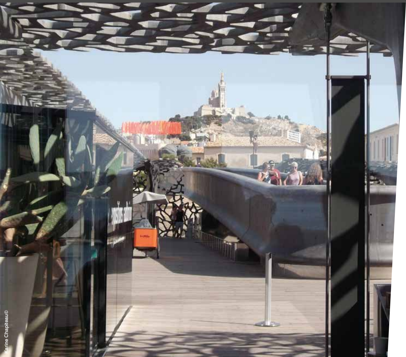
Basilique Notre-Dame-de-La-Garde vue du Mucem - Marseille