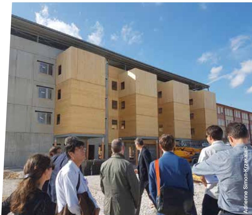
Visite du lycée Decomble - Chaumont

A cela s'est ajouté bien évidemment le travail lourd de préparation des RNIT 2018 organisées en partenariat avec le CNFPT.