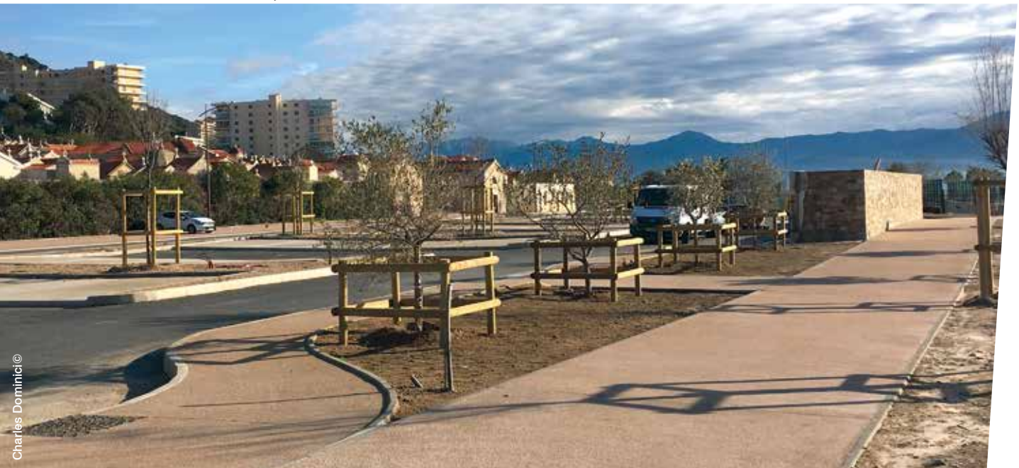
Voie verte réalisée sur la commune d'Ajaccio

Les groupes de travail fonctionnent sous forme de réunions ponctuelles, mais également par forums et plateformes d'échanges. Certains groupes nationaux ont des déclinaisons régionales sur la même thématique ou travaillent de manière plus transversale.