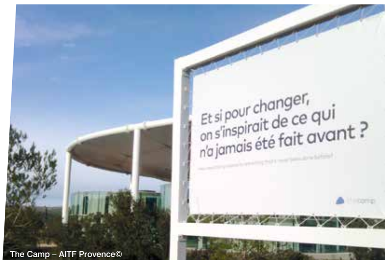
The Camp – AITF Provence©

La section met par ailleurs l'accent sur la communication envers ses adhérents, « la lettre interne », le « fil info » via les réseaux sociaux, sans oublier la plateforme collaborative.