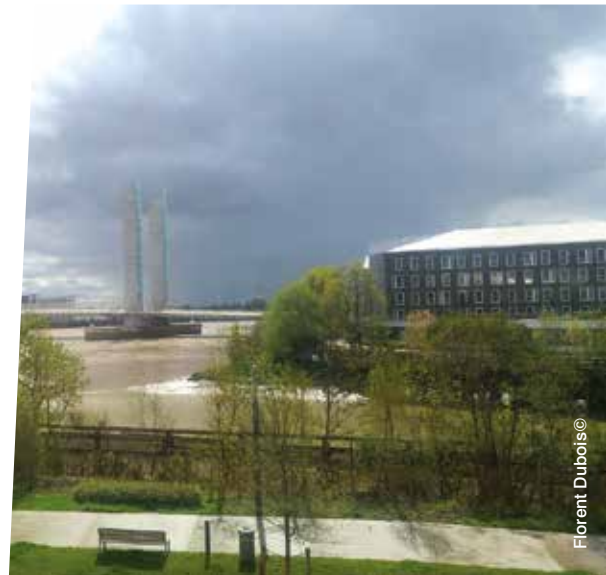
Visite de la Cité du Vin Vue sur le nouveau pont de Bordeaux (Bacalan - Bastide)