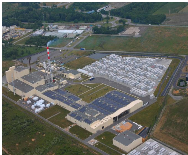
L'usine KNAUF INSULATION

Date : Vendredi 30 septembre 2016 Lieu : Lannemezan (Hautes-Pyrénées 65) Public : Ingénieurs