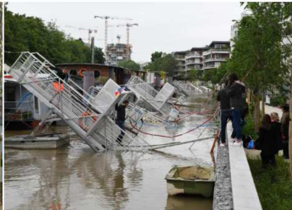
6 Juin 2016