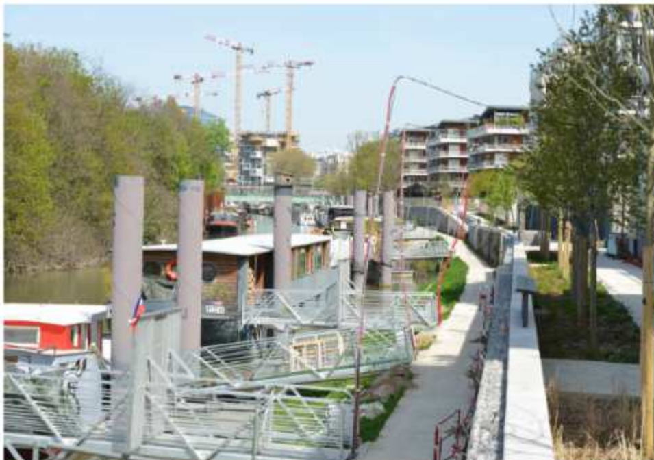
20 avril 2016